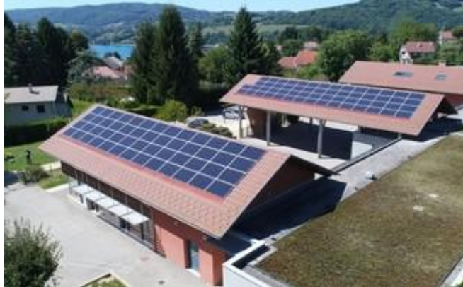
Billieu, école le petit prince (36 kW)

La maison Laurent et la salle socio à la Buisse (deux installations de 9 kW) et l'école de Billieu (36 kW)