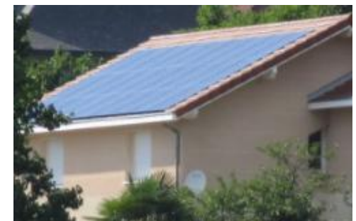
La Buisse, maison Laurent (9 kW)